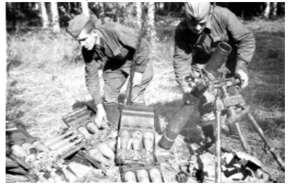
Красноармейцы 46 сд изучают трофейные немецкие минометы.