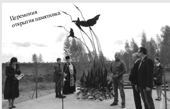
Церемония открытия памятника.

Новый памятник олицетворяет собой души воинов, павших смертью храбрых в боях с немец-